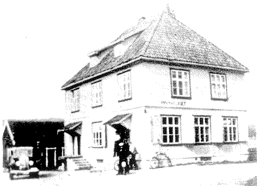
Samvirkelaget 1939. De bygde pene hus i gamle dager!

Så på høsten 1921 kunne det nye forretningsbygget tas i bruk, to og et halvt år etter at kooperasjonstanken for første gang slo ned hos austmarkingene. Et par år etter ble bestyrerleilighet gjort ferdig i 2. etasje og panel påsatt utvendig.