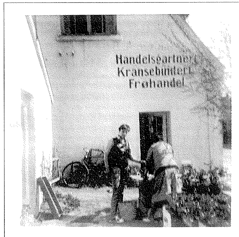
Kongsvinger Handelsgartneri