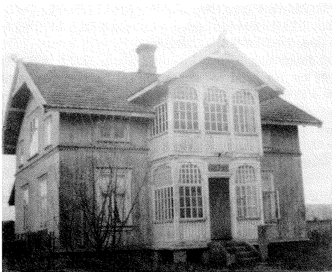
Gammelt bilde av Bøhn. Alder og fotograf ukjent.