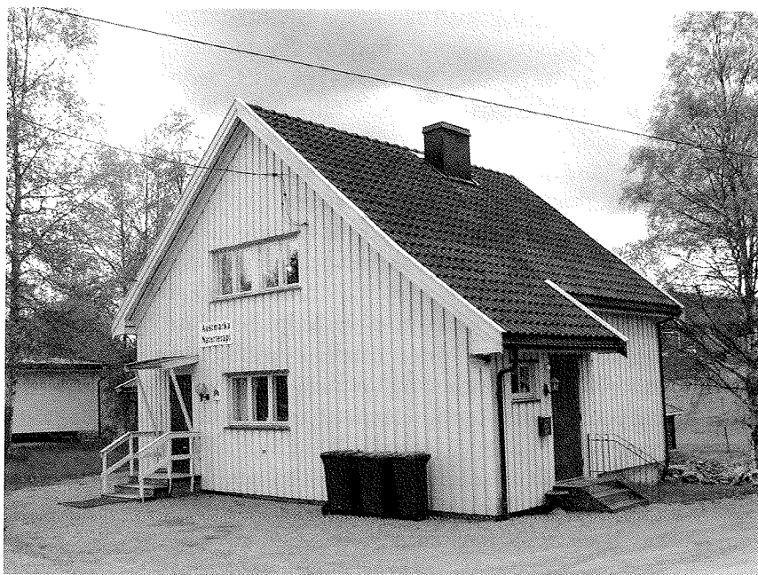
Austmarka folkebad – nå Sanitetens hus.