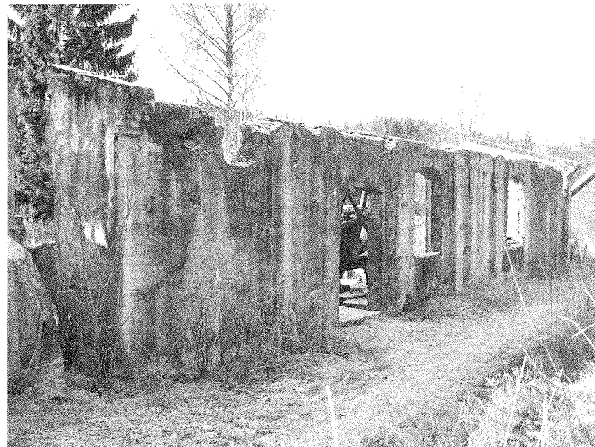
Ruinene etter Kjærsaga har vært en yndet lekeplass for unger i alle år siden saga ble lagt ned for over 70 år siden.

Som alltid går blikket mot ruinene mellom elva og “Tunet” når jeg rusler forbi. Kan det virkelig være de samme restene som ruvet mot himmelen for 60 år siden. Den gang vekslet de mellom ruiner av Austmarka domkirke, et gedigent slott eller Kjærsaga, alt etter som lekehumøret vårt var. Ærlig talt, vi fikk fort bakkekontakt, det var saga, og gudskjelov for det. Det var jo det mest matnyttige alternativet. Mange av oss kan sikkert takke saga for at våre forfedre overlevde slik at vi ble til.