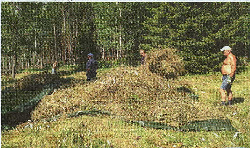
Pressenning var et enkelt og greit redskap til å få vekk graset.

27. juli og 3. august var det dugnad på slåttan i Abborhøgda. Første lørdagen slo vi ned graset, og neste helg raket vi opp og dro det unna. Vi kan være stolte av å ha så mange medlemmer som stiller opp til slåttann, selv i det fineste ferieværet. I alt var 30 personer med, deriblant fire dyktige barn.