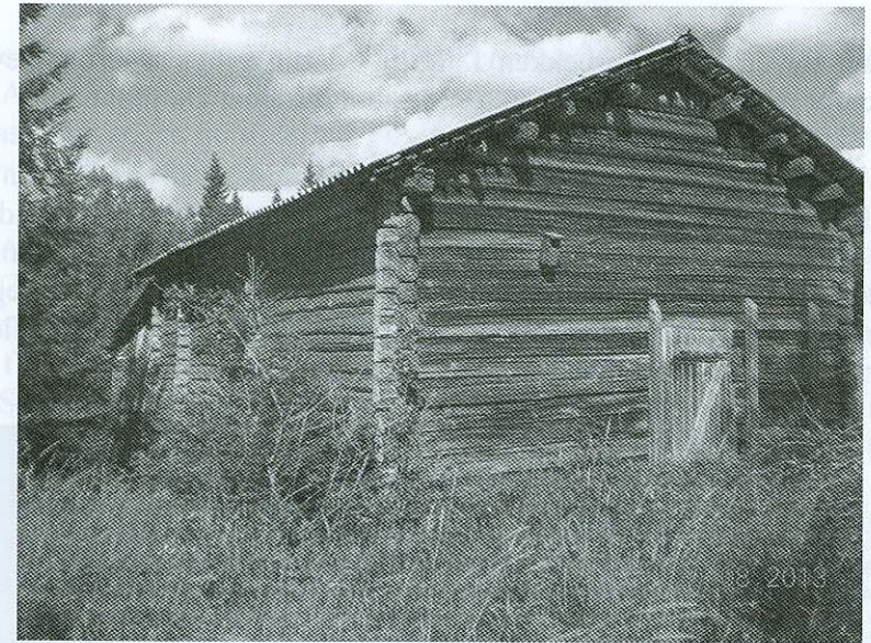
Låven er det eneste huset som står igjen i dag.