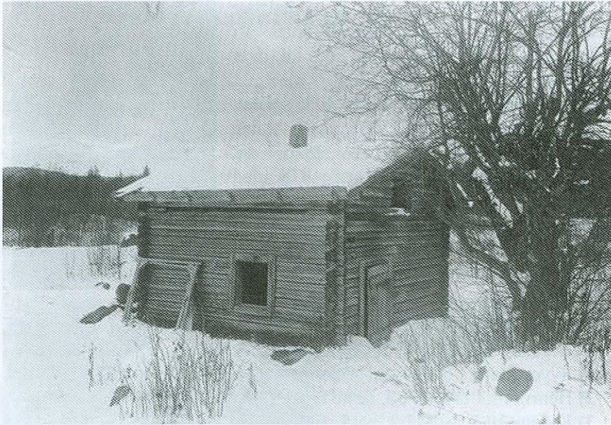
Våningshuset i nordre Fløtberget. Det sto der vegen gjennom jordet går i dag. Foto: Norsk Folkemuseum 1926.