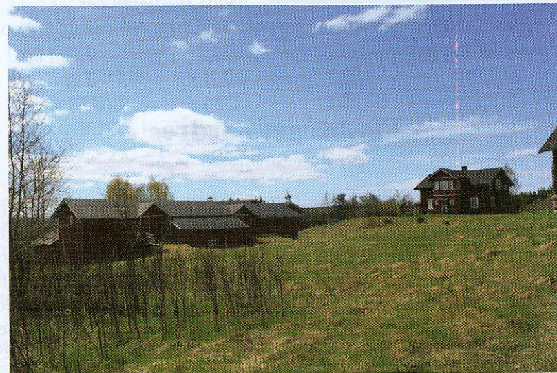
Bilde fra Orala.