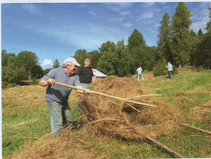
Slåttebilde Orala.

Vi har hatt flere dugnader med å slå og kjøre vekk gras som ellers ikke blir slått eller beitet. Torhild Moland har hatt beitedyr på en del av innmarka.