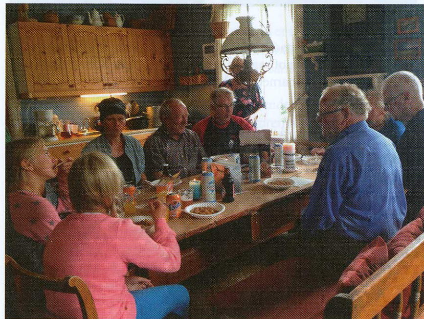
Middagspause på kjøkkenet i Orala

Det hviler en egen ro over Orala, og det kjennes godt å treffe andre likesinnede for felles innsats for dette flotte stedet. Uteområdene er store, og det er tungvint både å klippe og rake på den ujevne grunnen, men ingen så ut til å bry seg nevneverdig om det. Vi får heller ikke bruke traktor med store hjul der oppe, har eier, Skogfinsk, bestemt, og hester hadde vi ikke, så da fikk vi bruke de hestekreftene vi hadde! Nød lærer naken kvinne å spinne, heter det, så de "gutta" som minnet mest om dølagramper, ble spent for presenningen og hyppet av gårde! Lass etter lass med gras forsvant ned bak låven etter hvert som vi jenter hadde raket sammen haugene av slått gras. Det ble slått både med ljà og kantklipper, og dette arbeidet var det nok mannfolka som hadde best dreis på.