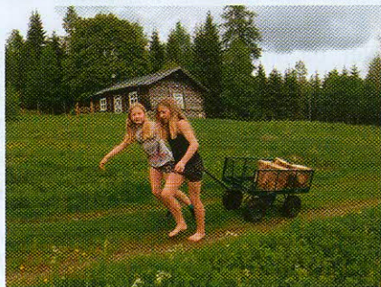
Tiril og Aurora kjører vekk vedkubber

Da sommeren var på hell, nærmere bestemt lørdag 16. august, møttes arbeidsgruppa i venneforeningen til slåttedugnad i Orala.