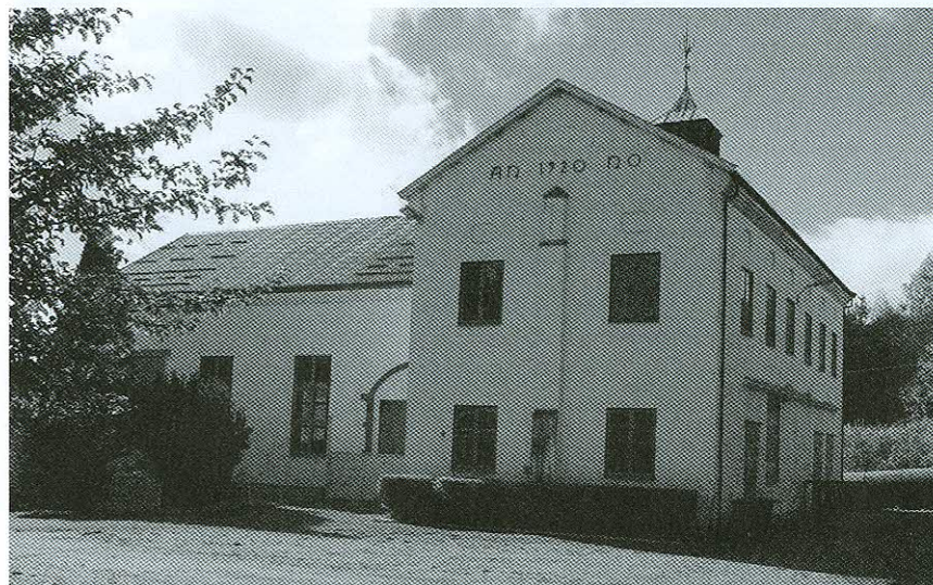
Kraftstasjonsbygget ved Brødbøl ble bygd 1920, og hele anlegget sto ferdig 1. mai 1921.

Vinger kommune sto for utbyggingen av Brødbølfoss-anlegget. Dette fikk en pris på 5,5 millioner kroner – en svimlende høy sum for snart 100 år siden. Men det var oppgangstider rett etter første verdenskrig, og kommunen hadde ikke store betenkeligheter med å ta opp lån på hele byggesummen. Det ville strømme inn penger både fra strømaabonnerter i Vinger og fra nabokommunene.