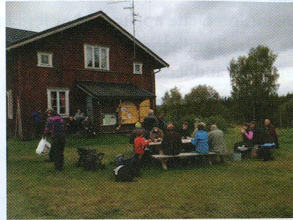
I Orala var det uteservering i vakkert høstvær