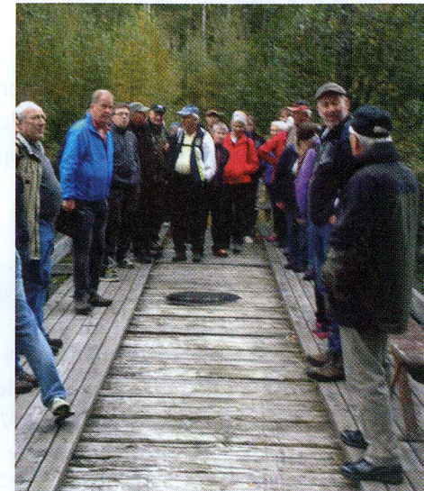
En del av vandrerne samlet på Fossum-brua.

Neste år håper vi å kunne fortsette vandringen i området, for Kjerret og Håvilrud har mer å by på.