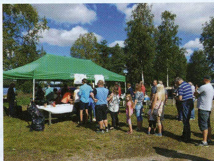
Mange i kø for å kjøpe rømmegraut og grytstappe