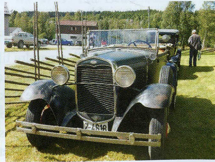
Ingen Marken uten slike klenodier!