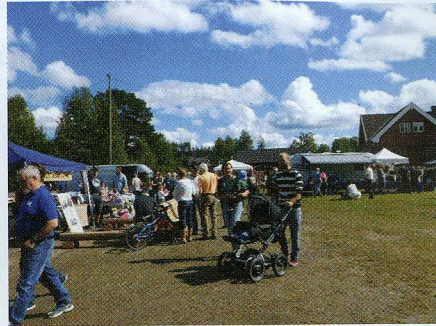
Store og små koste seg i finværet