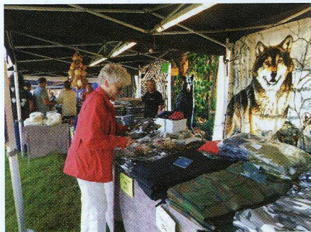
Over 30 salgsboder bod på mye interessant