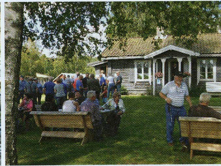
Godt å hvile litt i skyggen på Tunet