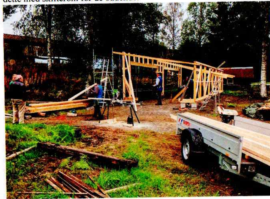
Snekkergjengen i full sving med å få tak over maskinene våre.

Lagets gruppe av håndverkere/snekkere er svært nyttige å ha når noe skal repareres eller bygges. Gruppen teller 5-6 personer og samles til innsats hver onsdag. Her er det åpent for alle som vil delta, og med på kjøpet får man sosialt samvær og en god følelse av å ha gjort noe nyttig for historielaget. Kanskje det kan etableres en dag i uka i verkstedet på Nystuen vinterstid der det kan drives med finsnekring. I sommer har gjengen laget ny kanal til spissmaskinen på mølla, og det er laget hyller i Nystuen. I forbindelse med spillet Årringer ble det bygd vegger, dører og plattinger. I disse dager blir det satt opp overbygg til stikkehøvel og bormaskin for vannrør. Forut for dette ble det planert og støpt fundamenter. Det neste prosjektet blir å bygge båthus ved badstua og kombinere dette med skifterom for de badende.